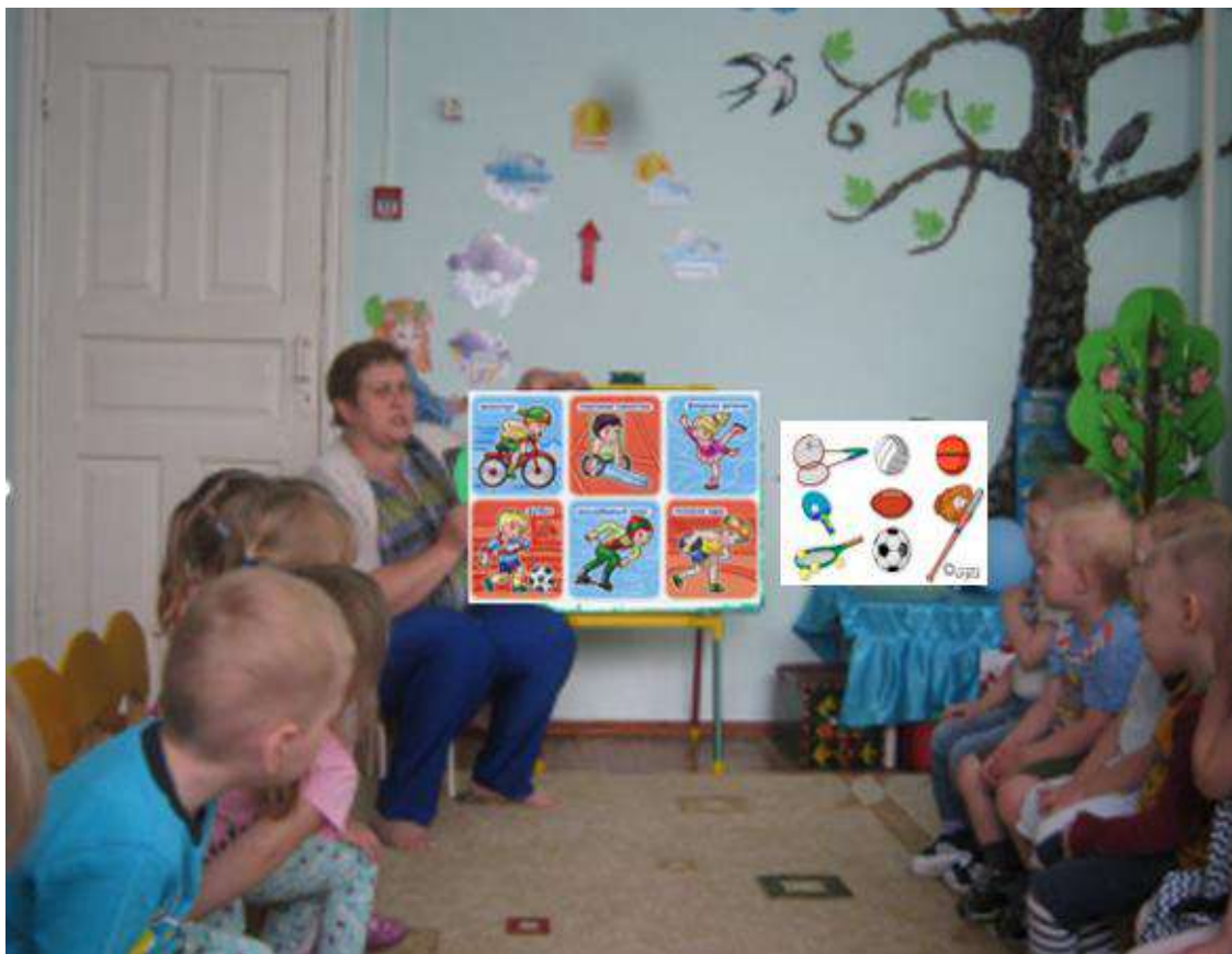
Беседа о видах спорта и футболе.

реакции, умение ориентироваться в пространстве. Выработались и личностные качества: целеустремленность, желание победить в честной борьбе, упорство, силу характера и благородство. Дети имели возможность выразить свое отношение к спорту в своих творческих работах. Праздник, посвященный спорту, прошел на одном дыхании, а дух соревнований еще долго витал в стенах детского сада.