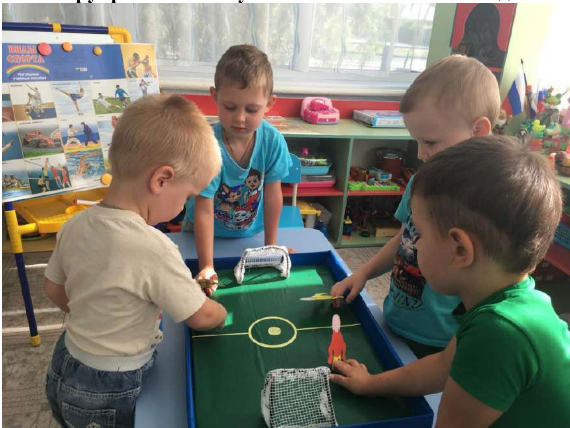
Настольная пальчиковая игра футбол