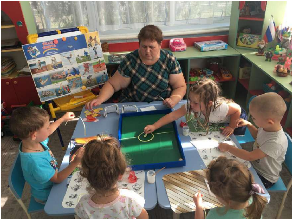
Конструирование из бумаги «Изготавливаем стадион»